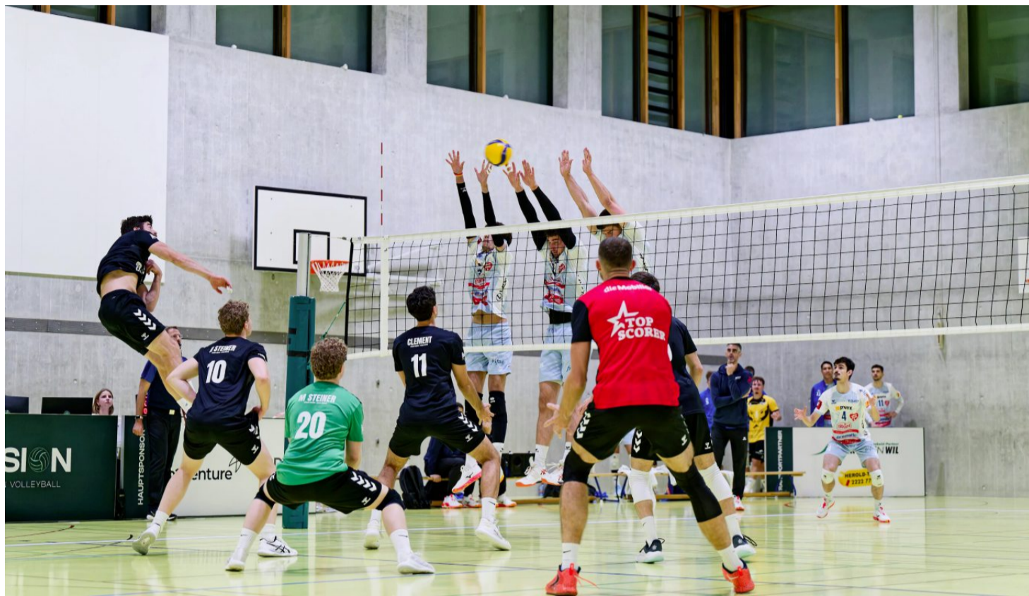
Für Volleyball braucht es eine hohe Halle. Auch deshalb trainiert und spielt der STV St. Gallen seit dieser Saison mehrheitlich in der Turnhalle Schönenwegen.

Diesen Platz können die Vereine gut gebrauchen. Laut der Dienststelle haben rund zwei Drittel der Sportvereine Bedarf an zusätzlichen Trainingseinheiten. Die neue Turnhalle im Riethüsli ist wichtig, mit ihr alleine ist das Problem aber nicht gelöst. Die Stadt hat deshalb das