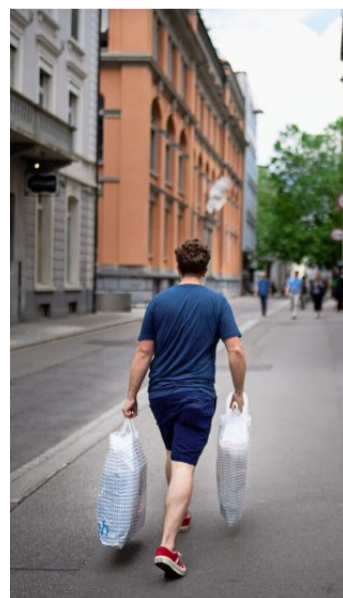
An einem durchschnittlichen Donnerstag sind um 15 Uhr am meisten Menschen an der Vadianstrasse unterwegs. (13. Juni 2020)

Wann die rund 119'000 Frauen und Männer tagsüber